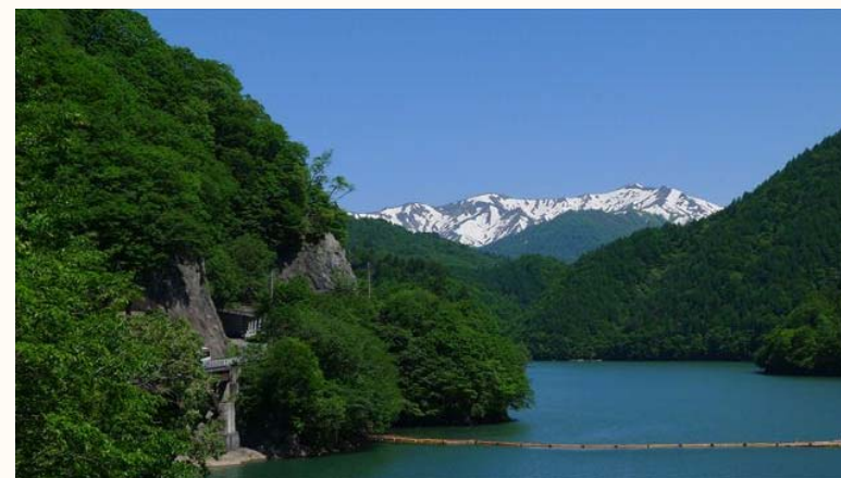
【日本製紙木材 須田貝社有林】